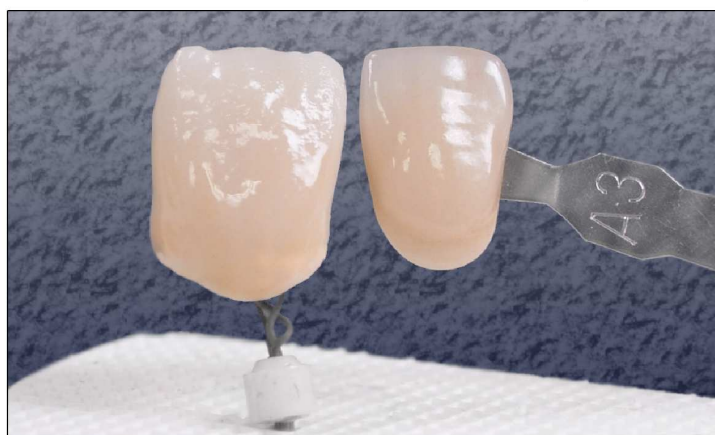
Foto 4 O elemento terminado