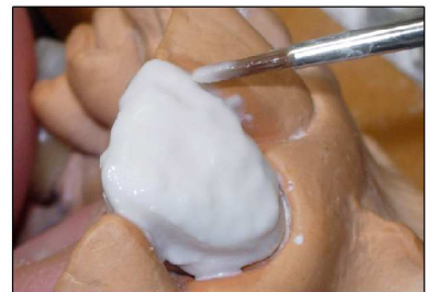
Foto 2 Die Schichtung