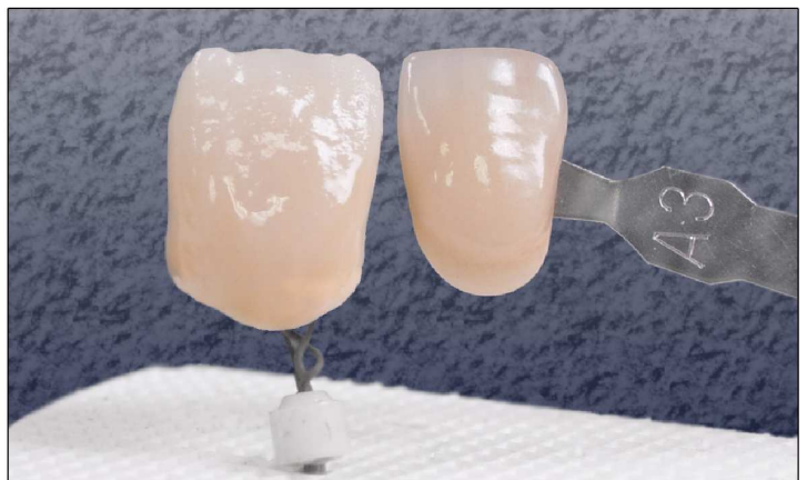
Foto 4 Die fertige Arbeit